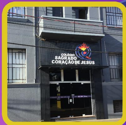
Colégio Sagrado coração de Jesus | SÃO BORJA