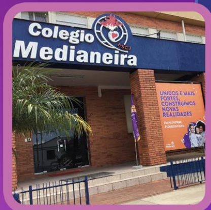
Colégio Medianeira | SANTIAGO