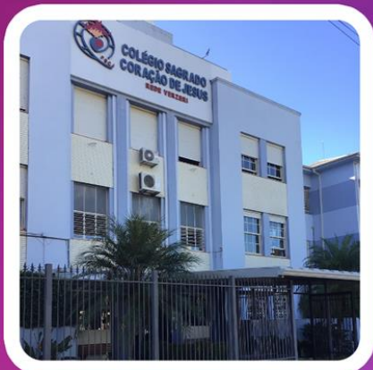
Colégio Sagrado coração de Jesus | IJUÍ