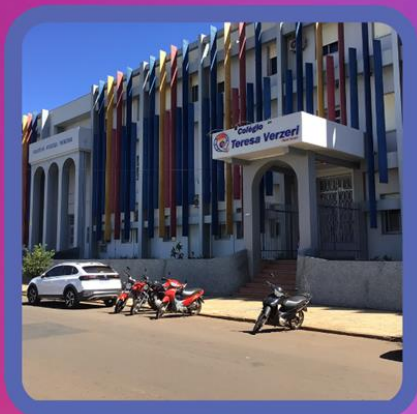
Colégio Tereza Verzeri | SANTO ÂNGELO